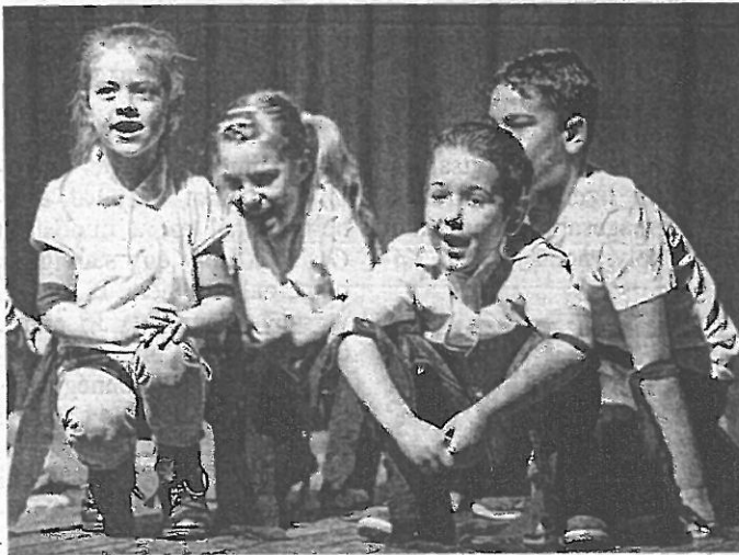
A programon a német nemzetiségi oktatásban részt vevő tanulók nép- és gyermekdalokat adtak elő

A rendezvényen a II. Rákóczi Ferenc Német Nemzetiségi Nyelvoktató Általános Iskola, illetve az Ady Endre Német Nemzetiségi Nyelvoktató Általános Iskola és AMI tanulói verses, zenés összeállítás, valamint nép- és gyermekdalokat adtak elő, majd a Berhidai Nyugdíjasklub tánc-csoportja csallóközi táncokat mutatott be, az Őszi Napfény Nyugdíjasklub táncosai pedig a Wenn's Kirmes elnevezésű táncsal léptek fel. lv