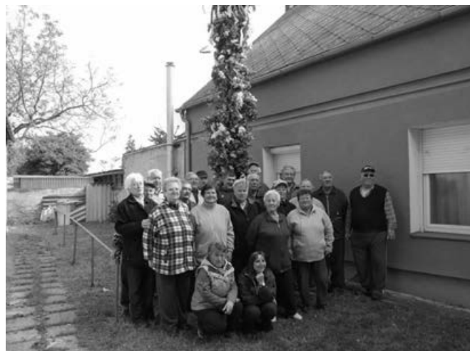
A lelkes kis csoport

A kitáncolása Ivó napján (Fiú nap) lesz.